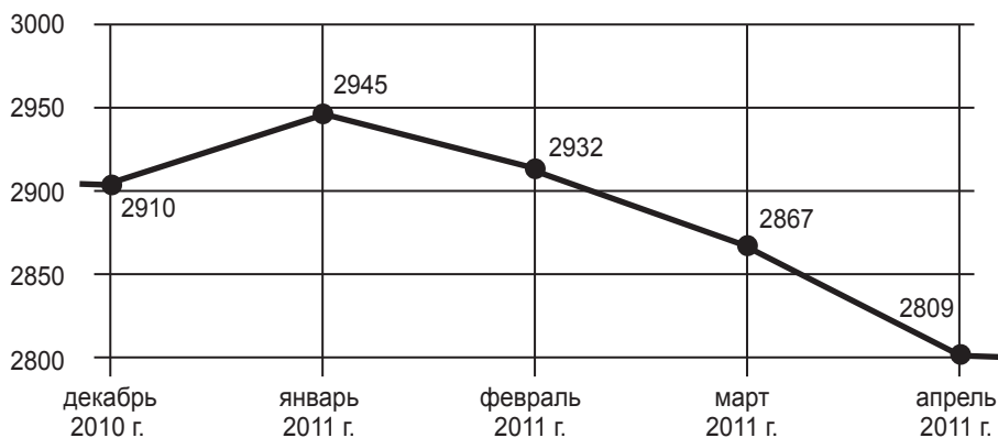
График 1. Индекс международной безопасности iSi (январь–март 2011 г.)

➔ Галия Ибрагимова. ИНДЕКС iSi ЗА ЯНВАРЬ–МАРТ 2011 Г.: ЗИМА ПЕРЕМЕН