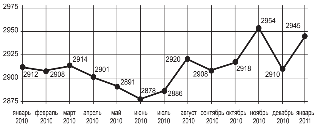
График 1. Индекс международной безопасности iSi в 2010 г.

↳ Галия Ибрагимова. ИНДЕКС iSi 2010: ИТОГИ ГОДА