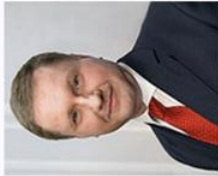
Konstantin von Eggert (Russia)