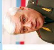
Evgey Buzhinsky (Russia)