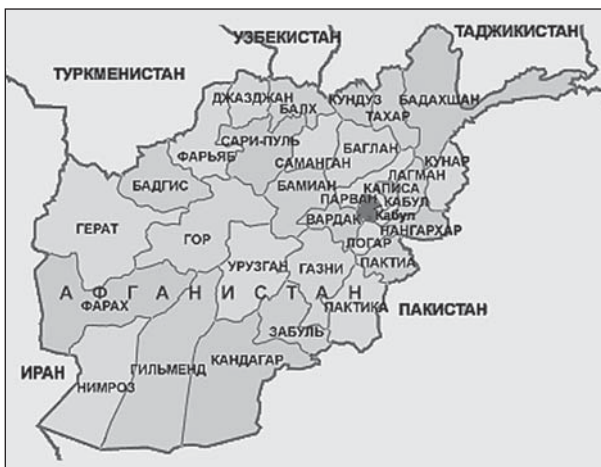
Рисунок 1. Провинции Афганистана

с Таджикистаном и Узбекистаном (Бадахшан, Тахар, Кундуз и Балх) и соседними с Туркменистаном (Джазджан, Фарьяб и Бадгис), перейдет к Талибану. Особое значение имеют Кундуз и Тахар, наиболее вероятные плацдармы возможного вторжения в Таджикистан. Неслучайно в Кундузе располагались базы Объединенной таджикской оппозиции (ОТО), опираясь на которые она действовала на территории Таджикистана во время гражданской войны 1992–1997 гг.