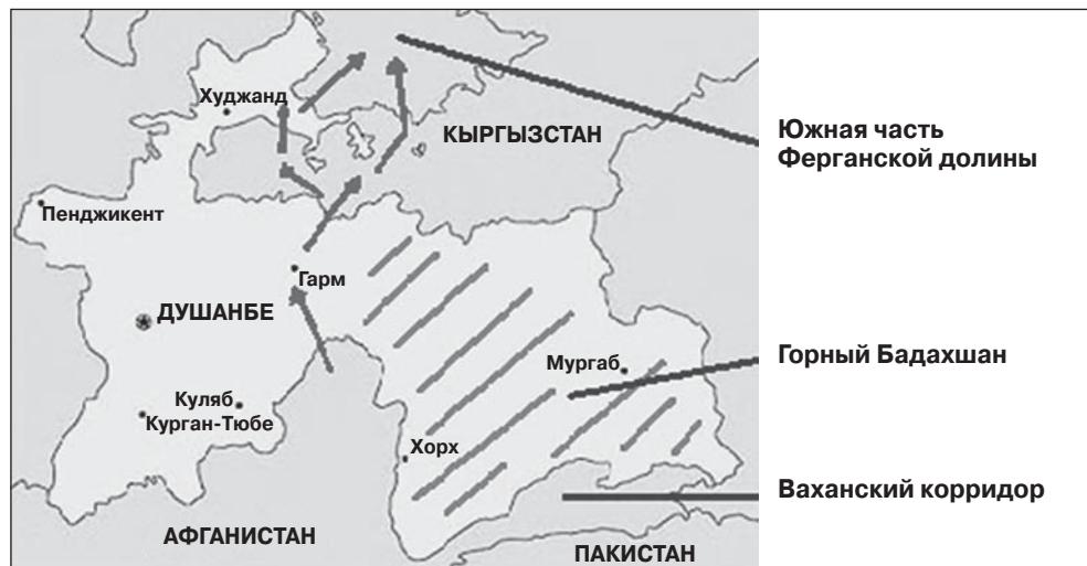
Наиболее вероятные направления проникновения экстремистских групп из Афганистана в Ферганскую долину

Тем не менее с учетом этого наиболее вероятный, а скорее, единственно возможный способ проникновения джихадистских группировок из Афганистана в Центральную Азию — скрытное движение малыми группами по так называемому восточному маршруту: по линии Тахар–Тавильдара–Гарм, вдоль границы высокогорных массивов Бадахшана, оттуда в Баткенскую и Ошскую области Киргизии и затем в южную часть Ферганской долины.