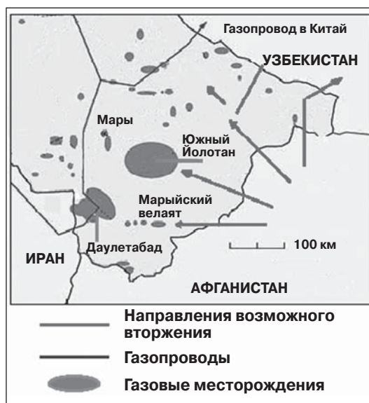
Рисунок 3. Возможные направления гипотетического вторжения в Туркменистан

Вопрос, однако, в том, насколько эти и предполагаемые некоторыми экспертами другие действия талибов опасны для туркменского режима. Игнорировать угрозу возможного вторжения, разумеется, нельзя, особенно имея в виду, что расстояние от границы с Афганистаном до газовых месторождений Южный Йолотан–Осман и Даулетабад в Марыйском веляйте менее 200 километров. Неверно было бы преуменьшать численность накапливающихся вблизи Туркмениста-