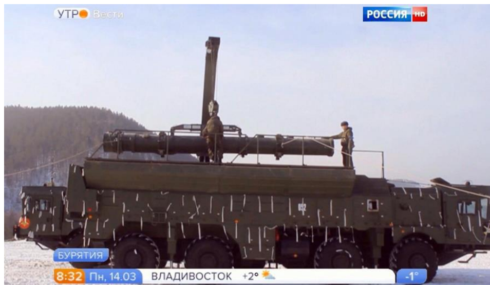
Рис. 1. Загрузка пусковой трубы в ТПУ комплекса Искандер-М .

Чтобы посчитать максимальную длину крылатой ракеты, которую можно разместить в пусковой установке Искандера , произведенного до 2016 г., достаточно взять фото и видео комплексов, произведенных ранее, и произвести несложные расчеты с помощью компьютерной программы Google SketchUp (методология, впервые предложенная Центром изучения проблем нераспространения в Монтерее). В частности, если использовать видеосюжет о военных учениях в Бурятии, показанный 14 марта 2016 г. каналом Россия 1 , то мы увидим сцену загрузки пусковой трубы ракеты в транспортно-пусковую установку (ТПУ) комплекса Искандер-М (рис. 1).