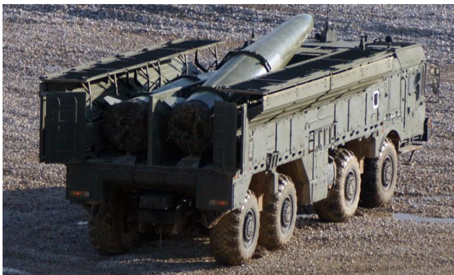
Рис. 4. ТПУ Искандер-М , 2015 г.

Наконец, в открытом доступе имеются изображения, подтверждающие, что ракета или пусковая труба теоретически могут быть размещены по всей длине отсека, которая, напомним, составляет 8 м 58 см (рис. 4).