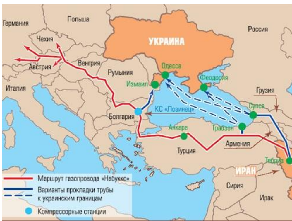
Рисунок 3. Возможные пути транспортировки иранского газа в Украину[64]

Кавказский вариант изначально имел не много шансов на воплощение. Здесь совершенно не существовало необходимой инфраструктуры, Грузия и Азербайджан не проявили активности, а Газпром достаточно скоро заблокировал выход через Армению.