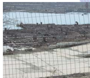
Киодо Цусин. 2005, 18 июля

Еще около 5 млн долл. Токио намерен затратить на создание системы контроля за уровнем радиации на земле и на море в районе, где производится разделка списанных атомных подлодок. Эти решения стали результатом поездки на Дальний Восток России парламентского секретаря МИД Японии Кацуюки Каваи, состоявшейся 9–11 июля 2005 г.